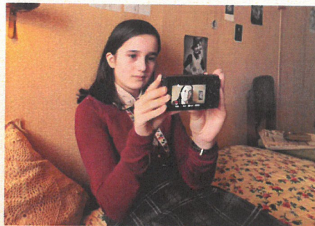
Luna als een vaak trieste Anne, tijdens de onderduik. Er bestaan in het echt geen foto's van Anne tijdens de onderduik.